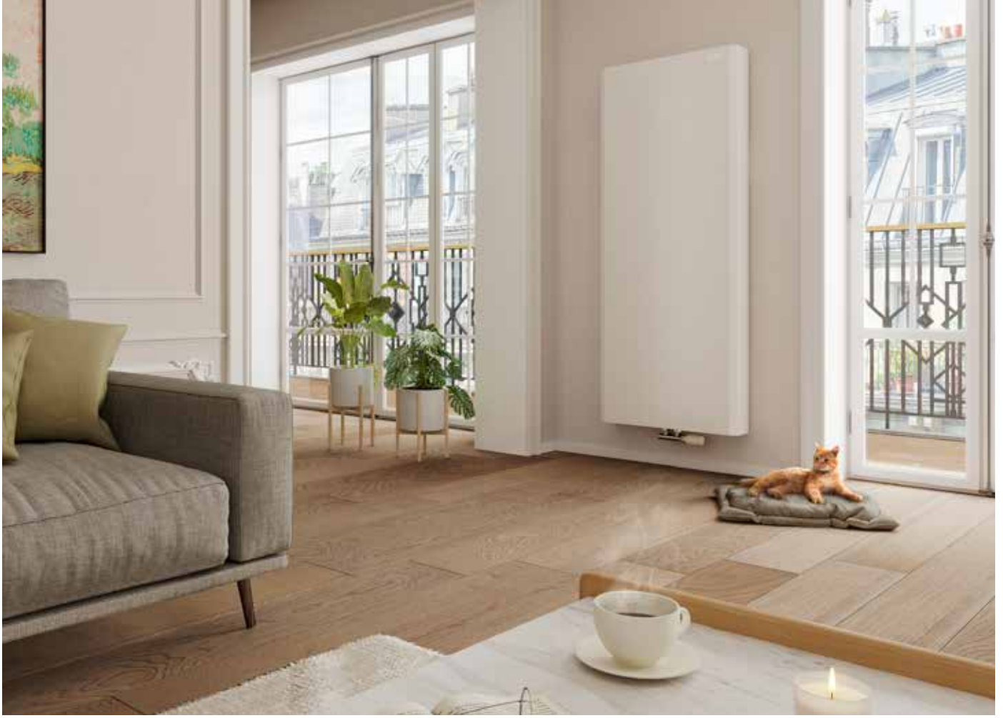
Tip-22 / PKKP Dikey Kanallı Panel Radyatör (TL/Adet)